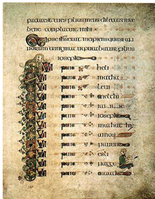
Albero genealogico di Gesù