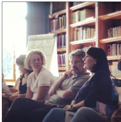
Due momenti del Seminario sulle Costellazioni Sistemiche Familiari a Verona (2012), condotte da D. Poggiolini

L'amore cieco non ha sapere, non conosce gli ordini dell'amore e spesso ci porta fuori strada.